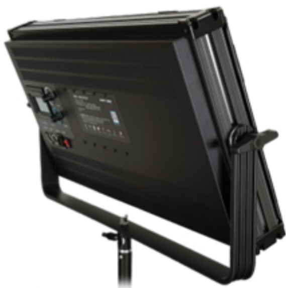
penta Ultra 200/300