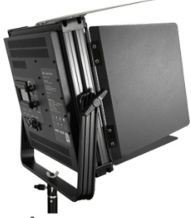
penta Ultra 120